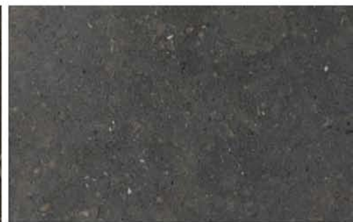
calcària Sant Vicenç abujardat caliza San Vicente abujardado San Vicente Limestone bushhammered calcaire San Vicente bouchardé